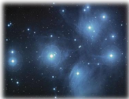
すばる(昴) / プレアデス星団

山形村社会福祉協議会では、障害児通所支援事業所の名称に、この『すばる』の名をいただきました。この事業所は、障害者関連サービスの複合施設の中の1つのサービス機能として設置し、機能性と利便性等に優れた利用施設として、また快適な施設環境に集いふれあい交流をいただく憩いの場として、地域の皆様から愛され、親しまれる施設をめざしています。皆様の一層のご愛顧の程をお願い申し上げます。 ————— スタッフ一同