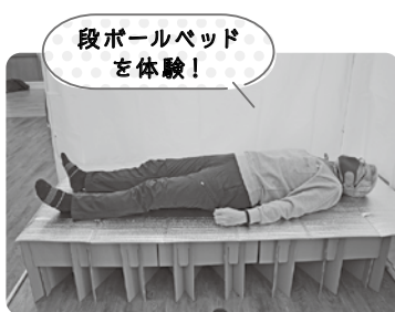
段ボールベッドを体験!