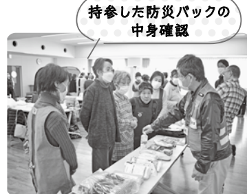
持参した防災バックの中身確認