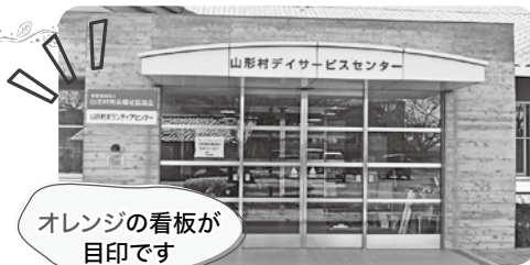
オレンジの看板が目印です

4月より社会福祉協議会事務局窓口がデイサービスセンター入口へ移動となりました。ご協力をお願いいたします。