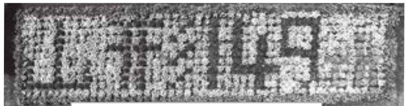
山形村 150 周年に向けての花文字花壇

農業や自然に触れる体験(野菜の栽培や花壇づくりなど)を通して、子どもや参加者と豊かな山形村の環境を守る活動に取り組んでいます。