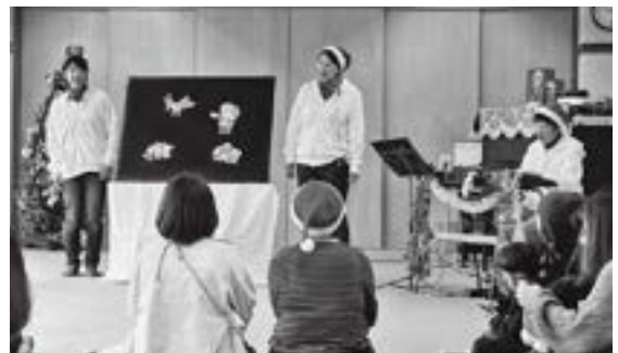
▲朝日村ぽけっと広場クリスマス会