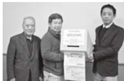
東日本大震災「山形村からできる支援」を考える会 285,009 円