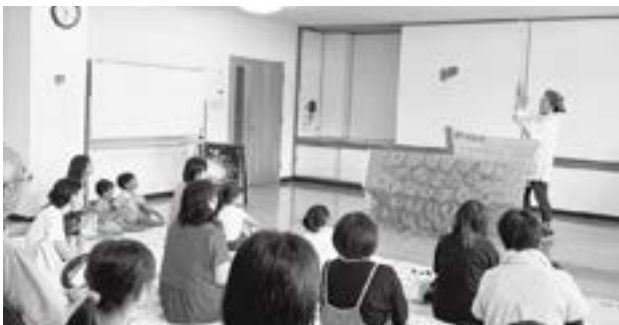
▲村図書館こぐまお楽しみ会