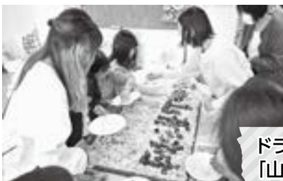
ドライフラワーを使った 「山形村150」パネル制作