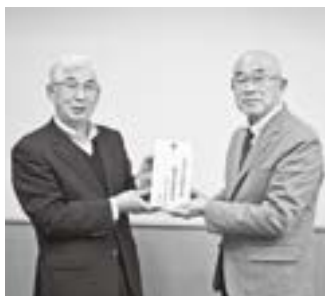
山形村公民館 14,379 円

他にも、下竹田西下連絡班をはじめとする団体の皆さまや、個人の皆さまよりたくさんのご寄附をいただいております。皆さまの温かいご支援、ありがとうございます。