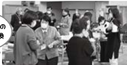
オリジナルの 名刺を交換