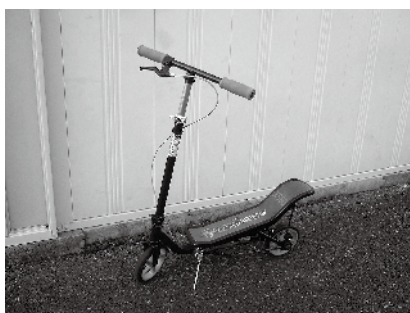
スペーススクーター（キックボード）： 水色、対象年齢8歳～