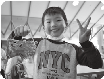
おちゃめなカボチャさんのイメージで作ったよ!