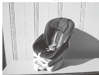
チャイルドシート： 茶色、対象新生児～