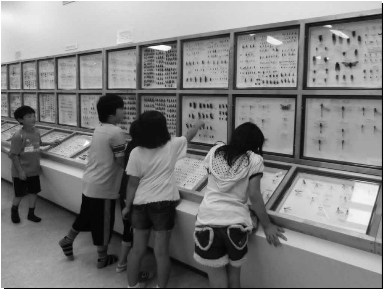
写真 信州昆虫博物館