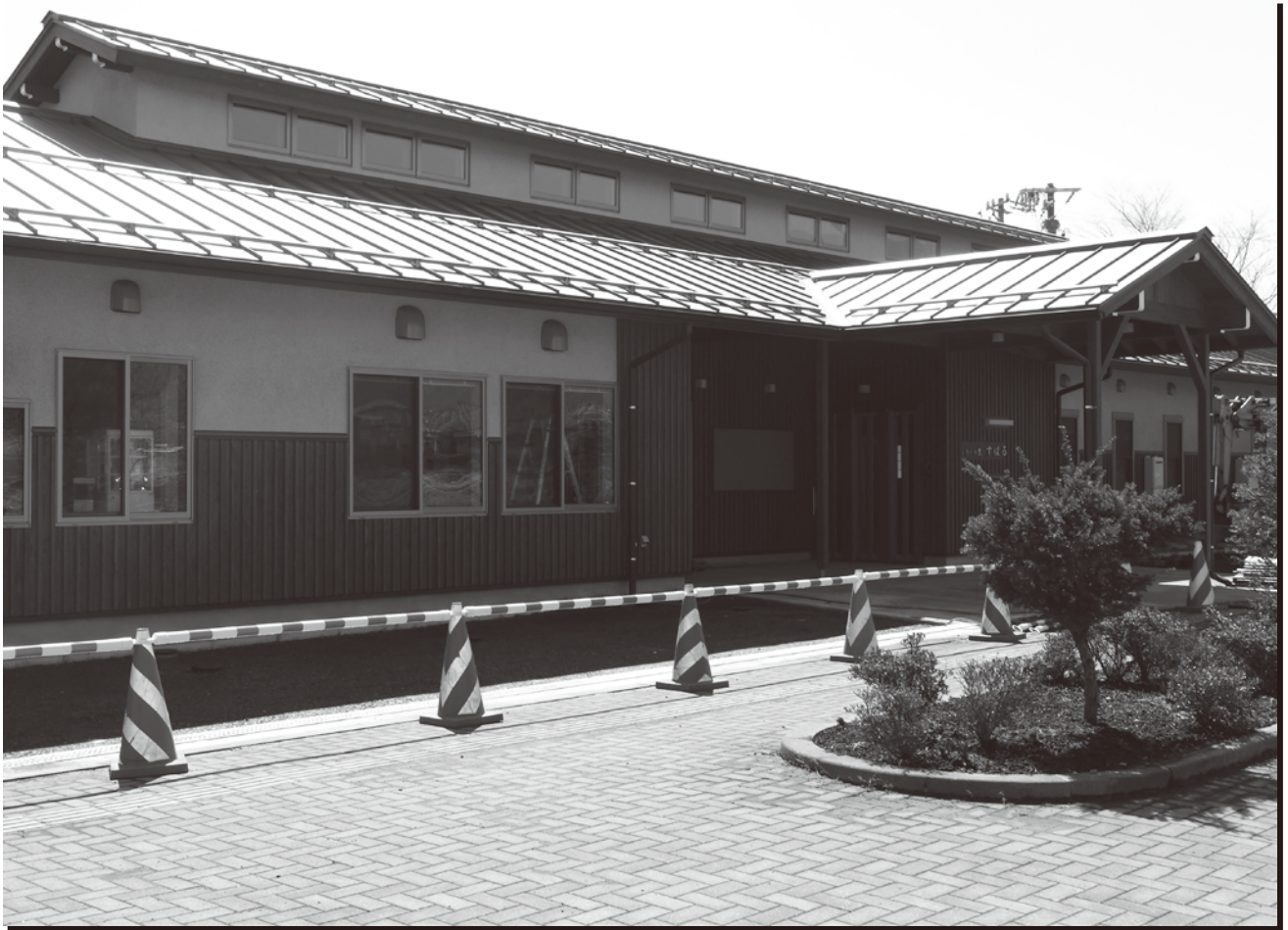
写真 完成間近のすばる外観