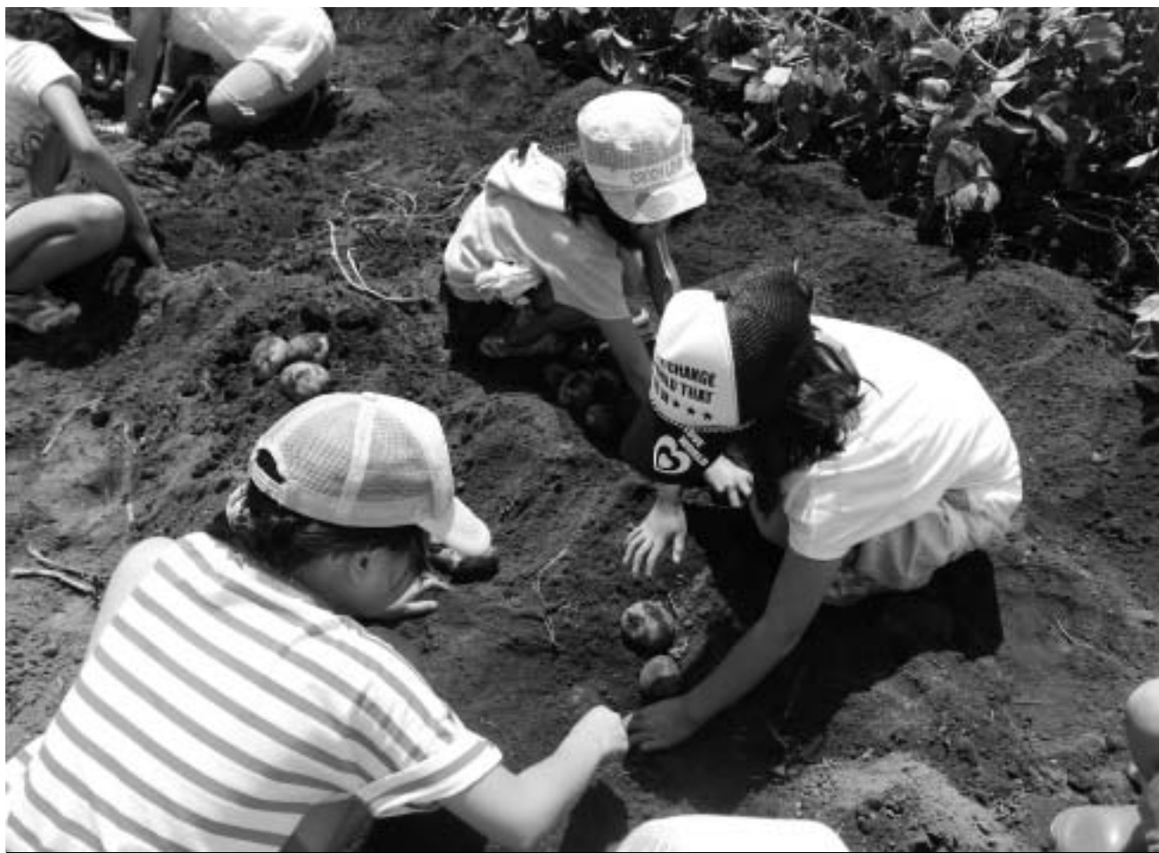
写真 8月9日 ジャがいも畑にて