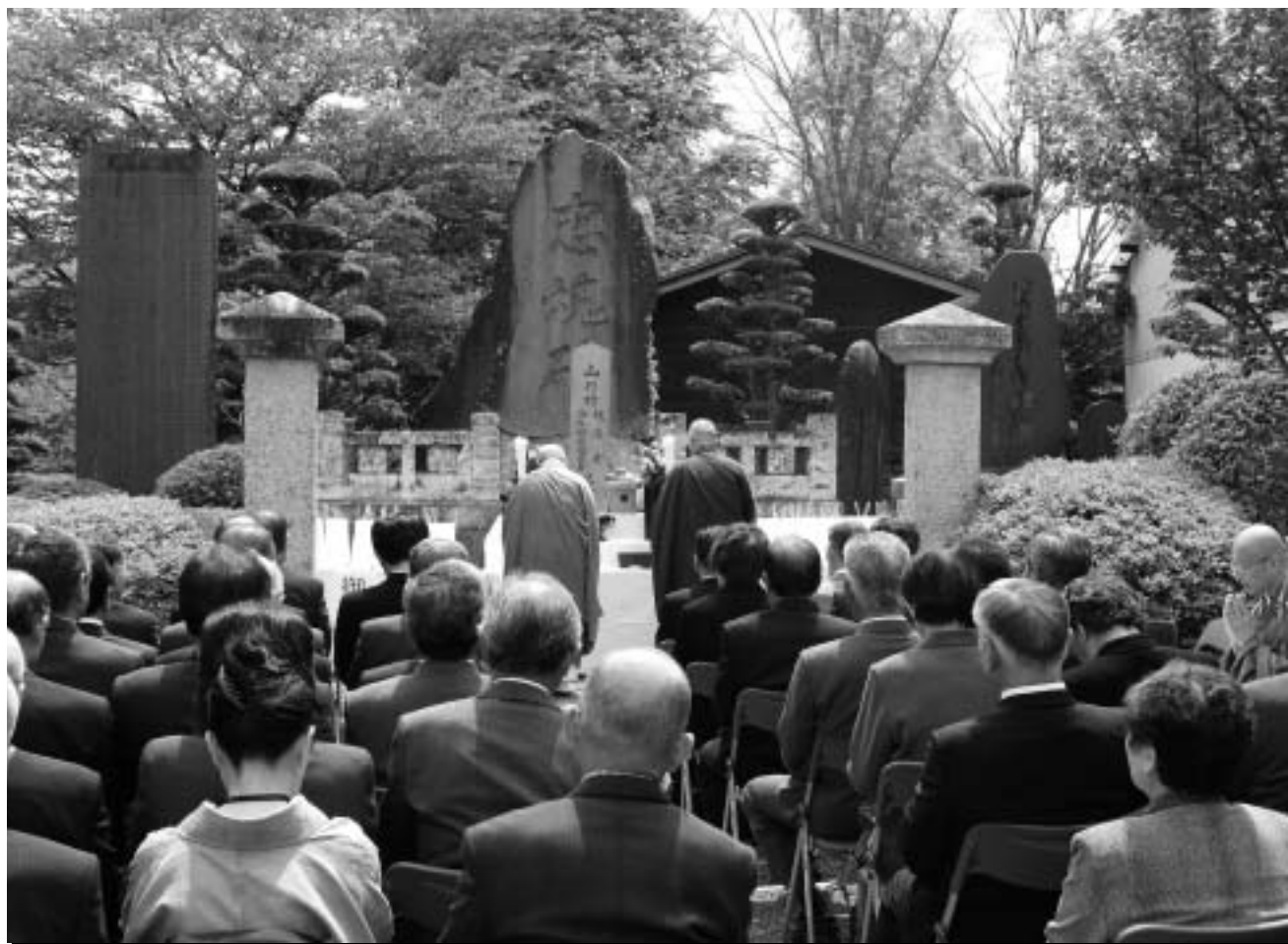
写真 5月11日 忠魂碑境内