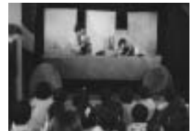
▲やまのこ共同保育園