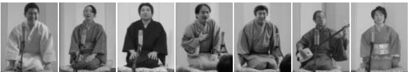
山形家すまいるさん