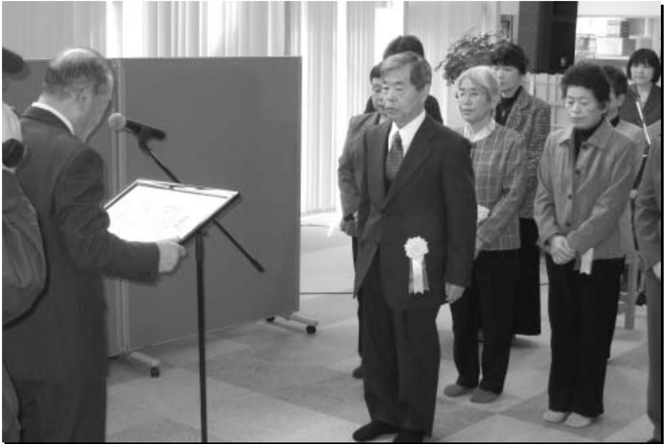
写真 12月18日 いちいの里にて