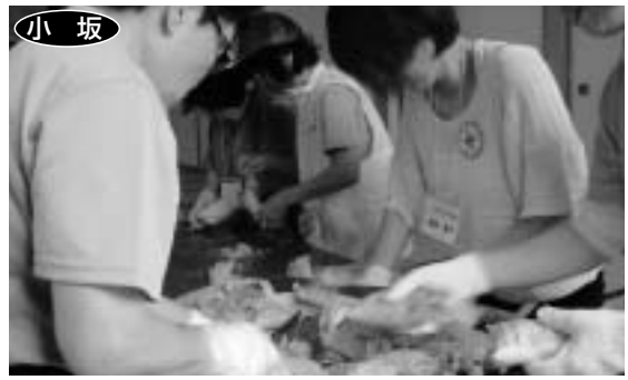
◀ハイゼックスによる炊き出し