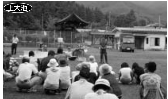
◀ボランティアバスパックの話