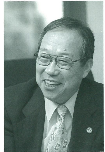
講師 茨城県立健康プラザ管理者 茨城県立医療大学名誉教授