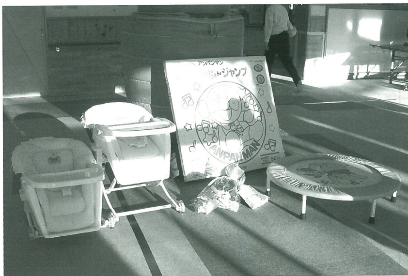
▲ふれあい児童館に遊具等が贈られました

売上金は、運営費と地域貢献費に充てられ、余剰金の一部が活動費として企画参加者に配分されるという方式が、今回試行的に採用されました。