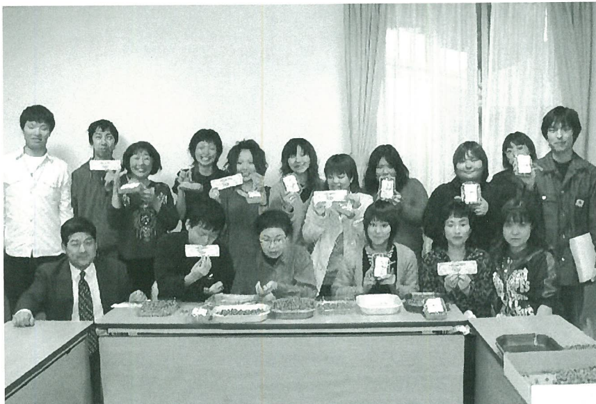
▲むかごちゃんプロジェクト参加者スナップから

また、販売にあたっては、食生活改善推進協議会の皆さんによるレシピ（調理方法のハンドブック）づくり、編み物クラブの皆さんなどによる贈答用の籠づくりと、大勢の皆さんの参加を得ることができました。